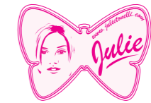
FONDATION JULIE TONELLI